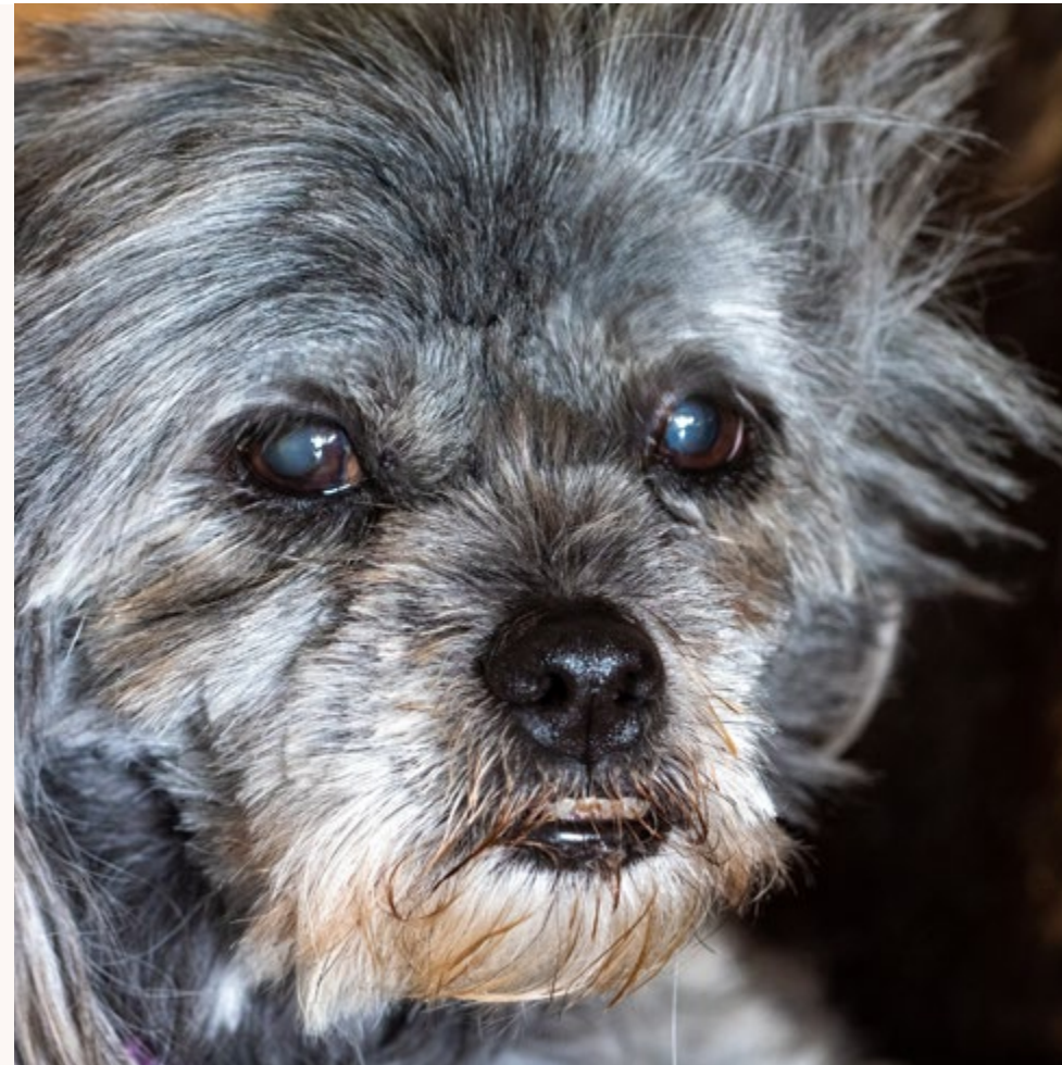
Nicht jeder Hundebesitzer ist bereit, sich den besonderen Anforderungen von Krankheit im Alter zu stellen.