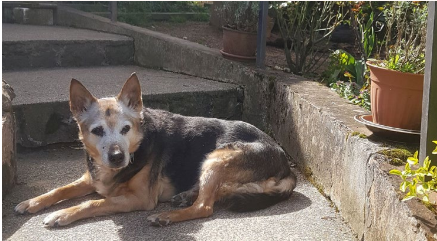
Hündin Cora ist 12 Jahre alt und hat einen Mastzellentumor 2. Grades.